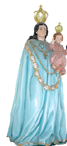
Nossa Senhora de Loreto