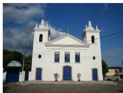
Paróquia e Santuário Nossa Senhora de Loreto